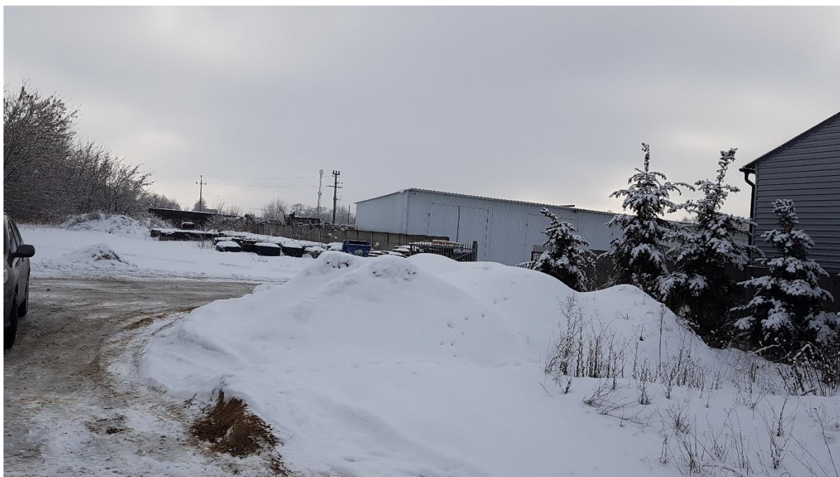
Wgląd z działki Nr 308/62 w kierunku południowym.