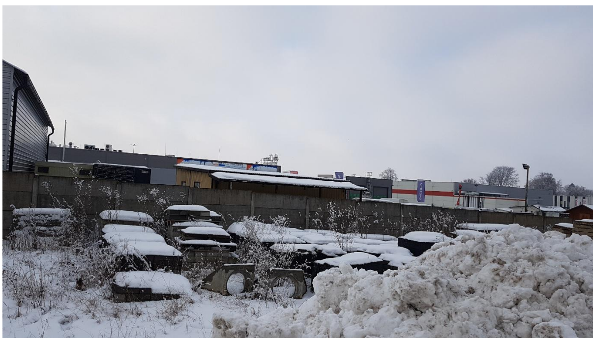
Wgląd z działki Nr 308/62 w kierunku zachodnim.