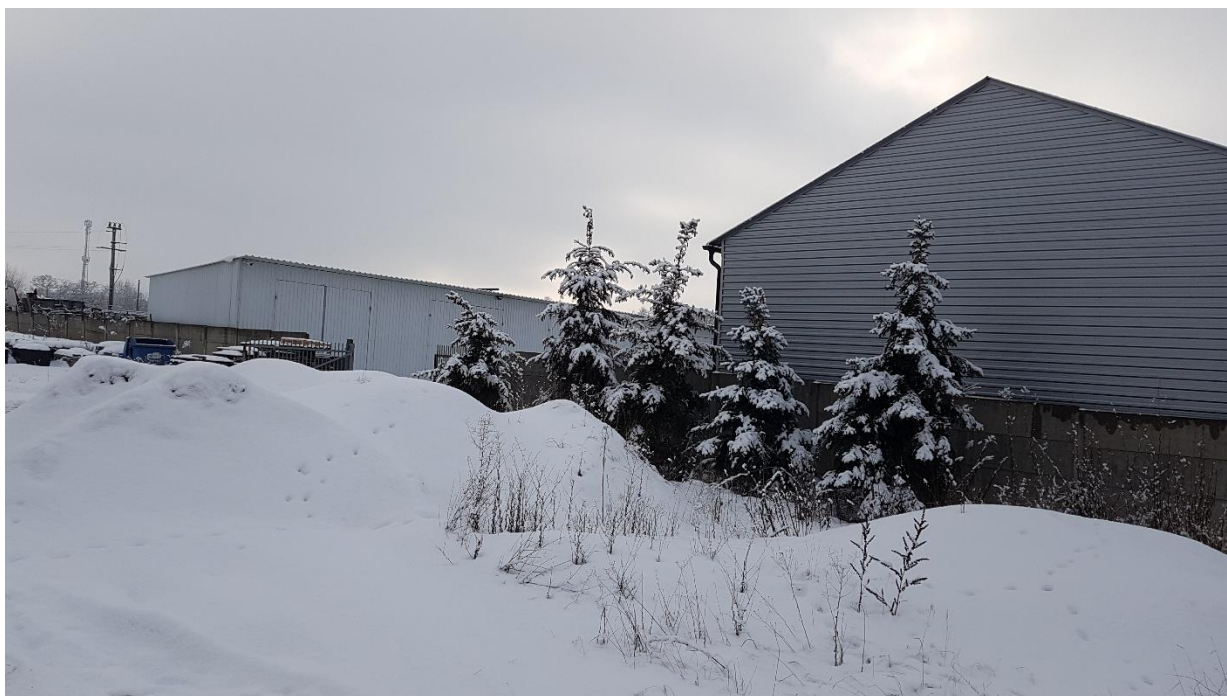
Wgląd z działki Nr 308/62 w kierunku południowo-zachodnim.