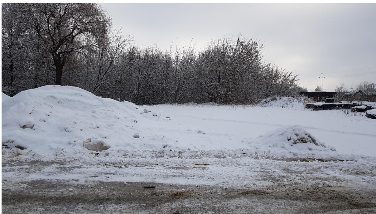
Wgląd z działki Nr 308/62 w kierunku południowo wschodnim.