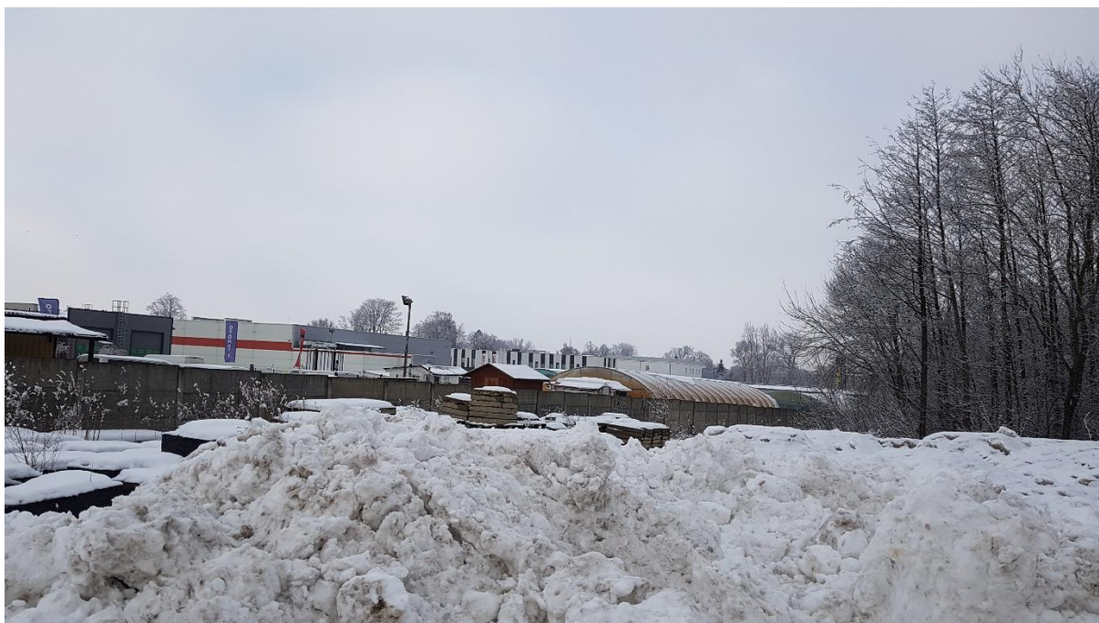
Wgląd z działki Nr 308/62 w kierunku północno zachodnim.