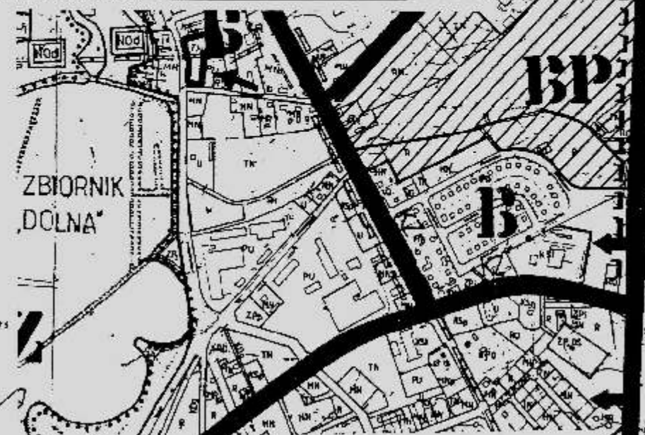
WYRYS z rysunku studium uwarunkowań i kierunków zagospodarowania przestrzennego m. Rawa Mazowiecka - "ROZWÓJ PRZESTRZENNY" Skala 1 : 10 000

→ □ - granice terenu objętego planem miejscowym